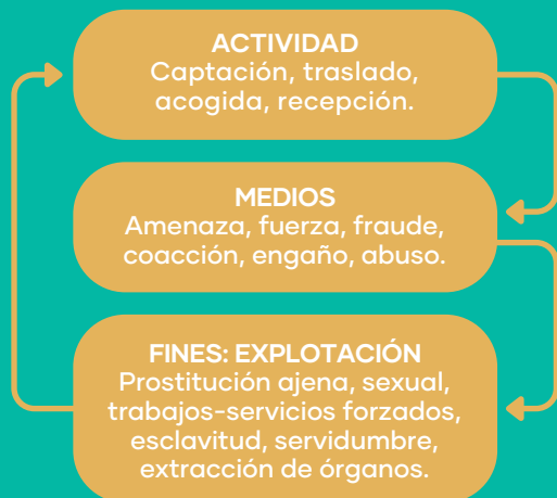
Figura 1. Elementos que definen la Trata de Personas

El principal objetivo de estas operaciones es la explotación de seres humanos , que puede concretarse en: